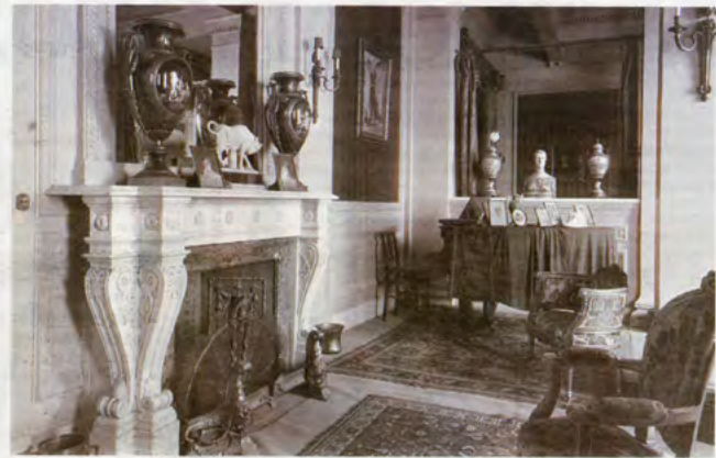
Το σαλόνι της οσίας Τσίλπερ όπως διαμορφώθηκε όταν πέρασε στα χέρια του τραπεζίτη Διονυσίου Λοβέρδου

«Το κτήριο παραμένει σε αχρηστία. Τυλιγμένο με λινόταπο σήμερα, έως το 2008 δεν υπήρχε καν η λεπτομερής αποτίκωση και μελέτη αποκατάστασης του, έργο που οφείλονταν μόνις πέποις, επισήμως στον Διευθυντή Αναστίλασης Νεώτερων και Σύγχρονων Μνημείων του υπουργείου Πολιτισμού και Τουρισμού Νικόλαος Χαρκιολάκης και οι αρχιτέκτονες μηχανικοί Ιργενίνα Δημητρίου και Φωτεινή Χαλβατζή, που έδωσαν διάλεξη προ ημερών επί του θέματος. Οι αρχιτεκτονικοί και στατικές μελέτες δεν έχουν υπάρξουν ολοκληρωθεί, ενώ το έργο μεταρρύθμισης του μουσείου του αυτού του – έργο κόστος 5 εκατ. ευρώ – δεν έχει προς το παρόν ενταχθεί στο ΕΣΠΑ.